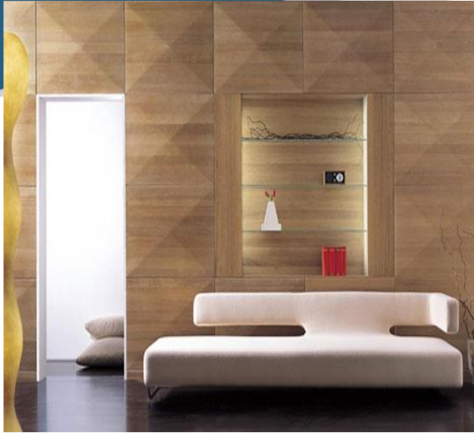
التضاد في الملمس