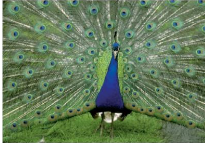
التأكيد او التميز فى البيئه الطبيعيه تظهر فى التاوس

التأكيد او التميز فى البيئه الطبيعيه يظهر فى الطيور كالتاوس وتميزه بحجمه والوانه وشكله عن أغلب الطيور الاخرى , والأسد وتميزه بشكله , وزهره عباد الشمس لكبر حجمها وتميز ألوانها , وغير ذلك.